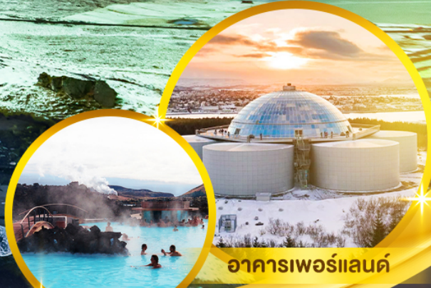
อาคารเพอร์แลนค์