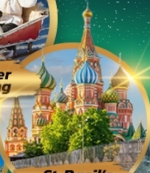
St. Basil's Cathedral