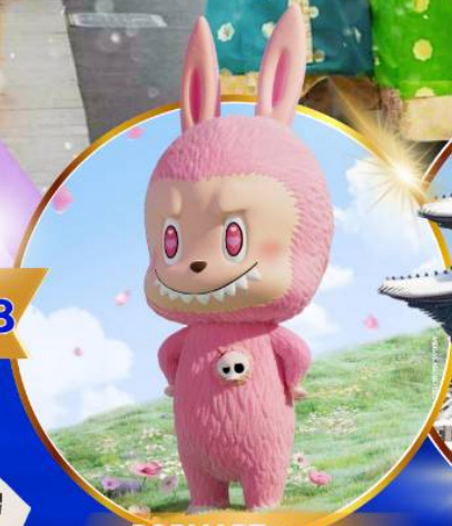
POP MART ฮงแด