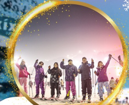
เล่นสกีสุดมันส์