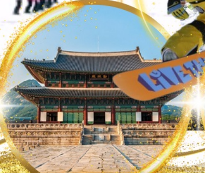
พระราชวังเคียงบกกุง