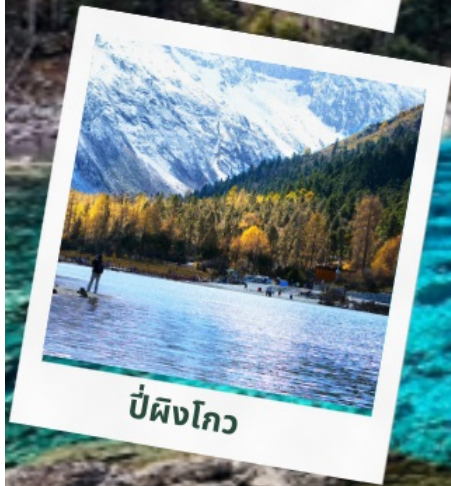
ป่ฝิงโกว