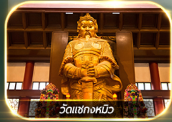
วัดเขกงหมิว