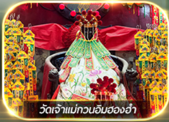
วัดเจ้าแม่กวนอิมของอ้า