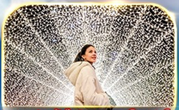
ชมงานประดับไฟนารามาโนะ ซาโตะ