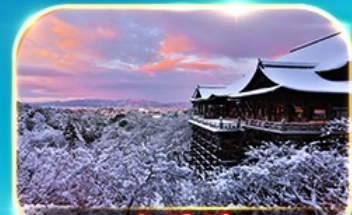
วัดคิโยมิตสึ