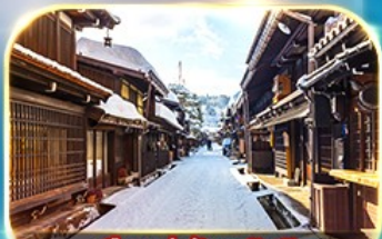
เมืองเก่าชินมาชิซุจิ