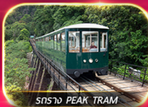
สราง PEAK TRAM

เที่ยวสวนสนุกแบบจัดเต็ม ทั้งอัมบุทญ และ ฮอปบิง จิมซาจุ่ย มงท็อก