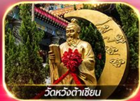
วัดหวงต้าเซียน