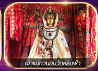
เจ้าแม่กวนอิมวัดหลินฟา

เต็มอิ่มทั้งบุญ และ ซ้อมปิ้งแบบจัดเต็ม จิมซาจุ่ย มงก๊ก เกาะฮ่องกง ชมวิวอ่าววิคตอเรีย วัดเจ้าแม่ทับทิม เจ้าแม่กวนอิม หาดริพัลส์เบย์ วัดหลินฟา โรงงานจิวเวอร์รี่