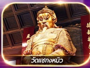
วัดเซ่งก้งหนิว