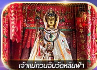
เจ้าแม่ทวนอิมวัดหลินฟ้า