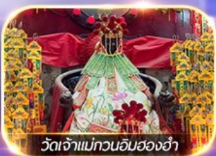
วัดเจ้าแม่ทวนอิมฮ่องกง