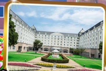
Win Hotel Nikko Huis Ten Bosch ★★★★★