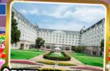
พัก Hotel Nikko Huis Ten Bosch ★★★★★