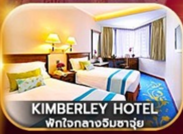
KIMBERLEY HOTEL พักใจกลางชิมางูย