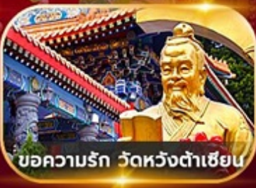
บ่อความรัก วัดหวังต้าเซียน