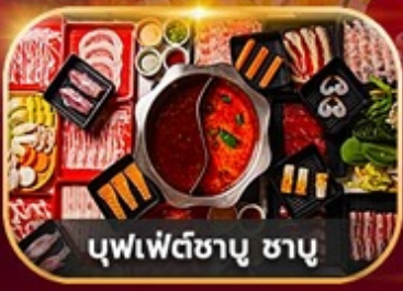
บุฟเฟ่ต์ซาซุ ซาซุ