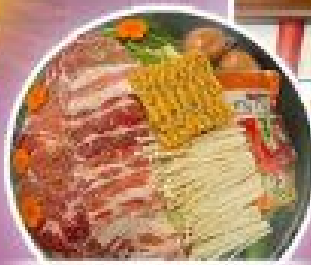
ซาปู ซาปู ฮ่องกง

พักฮ่องกง 2 คืน พักใจกลางย่านมงก๊ก วัดแชกงหมิว เจ่าแม่กวนอิมรพัสสเบย์ วัดกวนจู วัดหวังต้าเซียน วัดฮ่องกง วัดเจ้าแม่ทับทิม