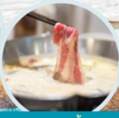
เมนูพิเศษ สุกี้หม่าล่า