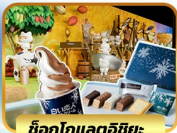
ช็อกโกแลตชิชยะ