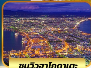
ชมวิวดาโกดาเตะ

SPECIAL PROMO จอง 10 ท่านแรก ลด 2,000 บาท