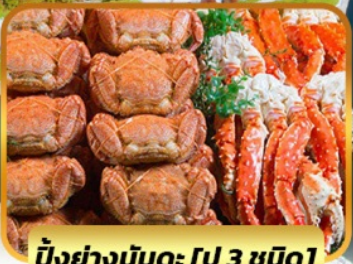
บั้งย่างนัตตะ [ปู 3 ชนิด]