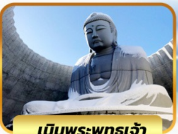
เป็นพระพุทธรเจ้า

05-10, 12-17, 19-24 พย. 26 พ.ย. - 01 ธ.ค. 67