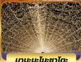
เกาะนะโตะซาโตะ