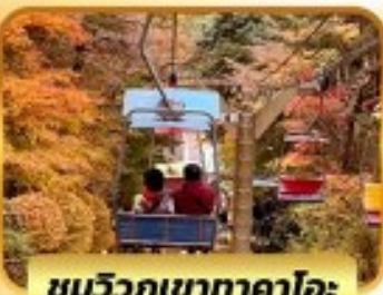
ชมวิวภูเขาทาคาโอะ