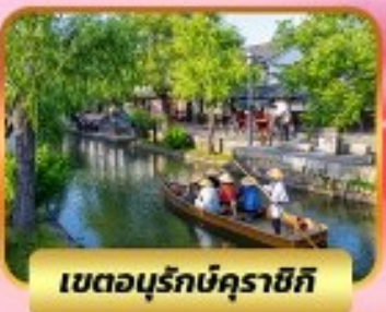
เขตอนุรักษณ์คุราชิกิ