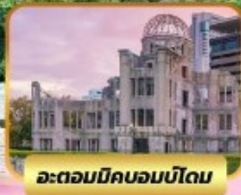
อะตอมบิคมอบบิโดม