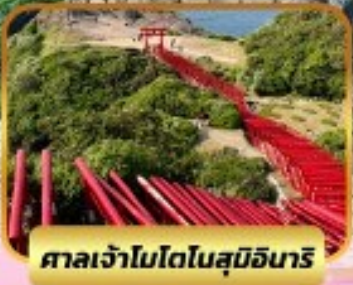
ศาลเจ้าโมโตโมสุบิอินาริ