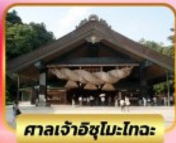
ศาลเจ้าอิซุโมะโทะวะ