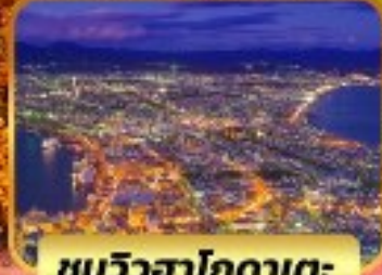
ชมวิวฮาโกดาเตะ