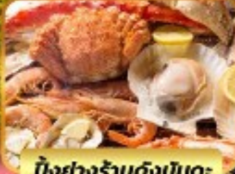
บ๊องย่างร้านดังนินตะ