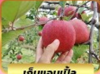
เก็บแอปเปิ้ล