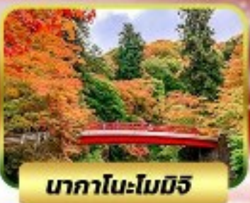
นากาโนะโมมิจิ