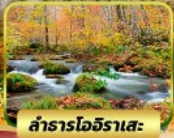
ลำธารโออิราเสะ

8D 5N แชออนเซ็น 4 คั้น ไม่ลงร้านช้อปปิ้ง ไม่บังคับทิป