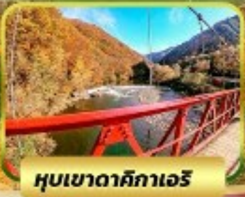
หุบเขาดาคิกากะเอริ