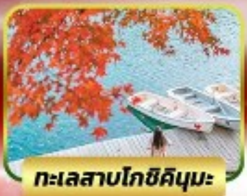
ทะเลสาบโทชิคิคุมะ