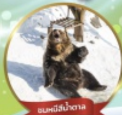
ฟาร์มหมีสึน้ำตาล