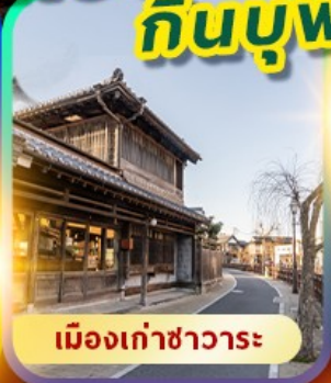
เมืองเก่าซาวาระ