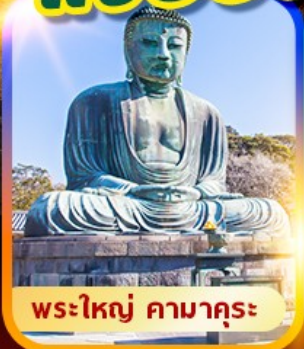
พระใหญ่ คามาคุระ