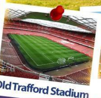
Old Trafford Stadium