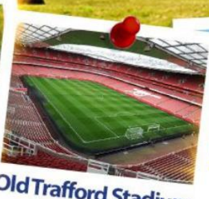
Old Trafford Stadium