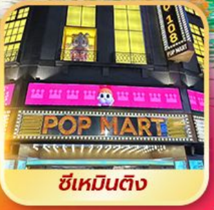
ซีเหมินติง