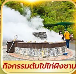
กิจกรรมต้มไข่ไท่ผิงซาน

เที่ยวคุ้ม!! อุทยานใหม่ ไท่ผิงซาน ไทเป - ทะเลสาบ - เหย้หลิว - ฮวาเหลียน