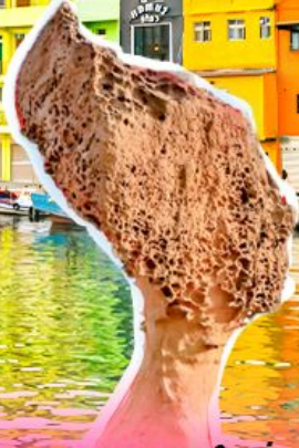
อุทยานเหย้หลิว