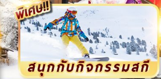
สนุกกับกิจกรรมสกี