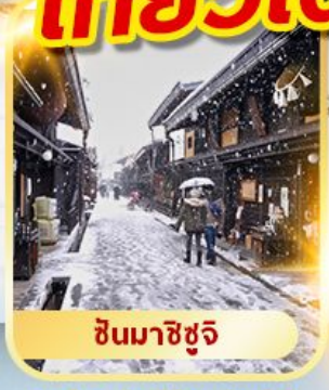
ชินมาชิซุจิ