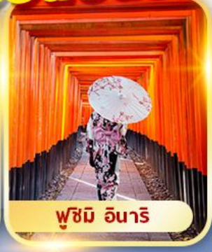
ฟูชิมิ อินาริ