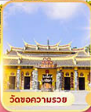
วัดขอความรอย