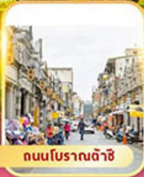
ถนนโบราณต้าชิ