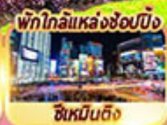
พักใกล้แหล่งช้อปปิ้ง ซีเหมินติง