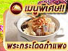
เมนูพิเศษ!! พระกระโดดกำแพง