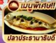
ปลาประธนาธิบดี