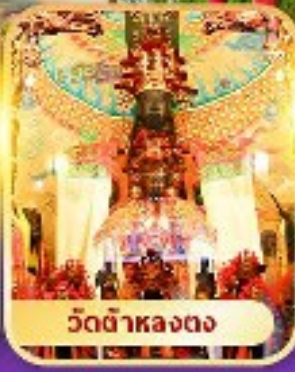
วัดต้าหลงตง