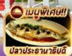
เมนูพิเศษ!! ปลาประจานาธิบดี