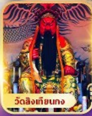
วัดลิ่งเทียนกง