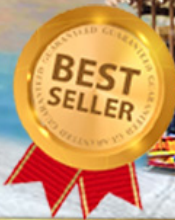
เล่นหิมะ-จ้ำจี้ โหดหทัยคิดถึง