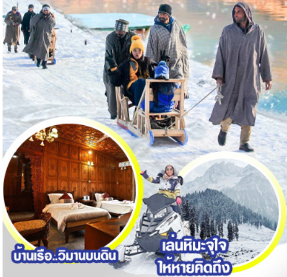
บ้านเรือ..วิมานบนดิน