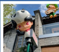
ถนนคนเดินซอยกว้างแคว