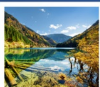
จี๋จ้ายโกว

อุทยานภูเขาสี่ดรุณี / อุทยานชวงเฉียวโกว / ทะเลสาบเตี้ยซีไห่ / อุทยานแห่งชาติจี๋จ้ายโกว โซ่วทึเบต / เมืองโบราณชงพาน / ซอยกว้างแคว / POP MART / ถนนคนเดินซอยกว้างแคว