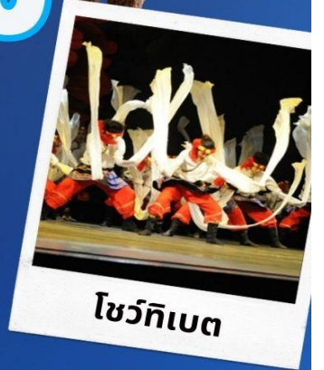
โชว์ทิเบต