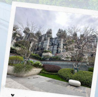
ห้าง Tian AN 1,000