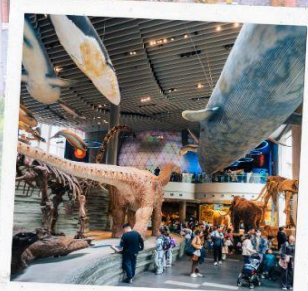
Shanghai Natural history Museum