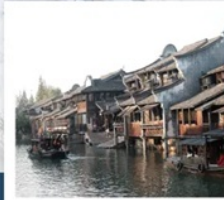
เมืองโบราณผานหลงกว่าจิน