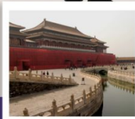
พระราชวังกู่กิง