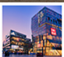
ย่านซานหลี่ถุน