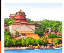
อวี๋เหอหยวน