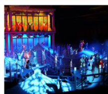
โรงละคร ONLY HENAN