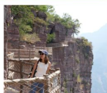
เขาทียนเจี๋ยซาน