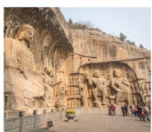
กำหินหลงเหมิน