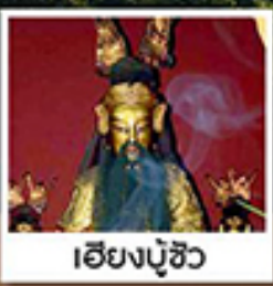
เอียงบู๊ซิว