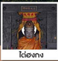
โต๋ฮองกง