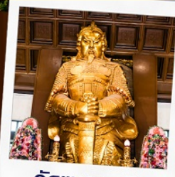
วัดแฉกหมีว