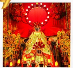
เจ้าแม่กวนอิมของฮ่า

โรงแรม Eaton Hotel และ iclub Mong Kok Hotel