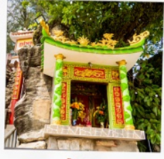
ศาลเจ้าดิงขาว