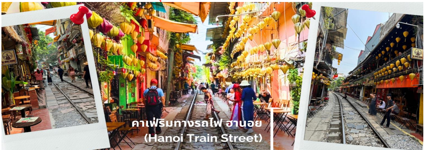
คาเฟ่ริมทางรถไฟ ฮานอย (Hanoi Train Street)