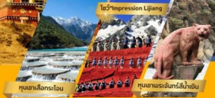
หุบเขาเสือกระโจน