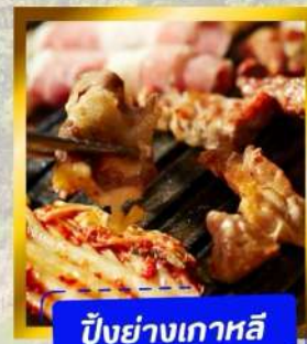
ปิ้งย่างเกาหลี