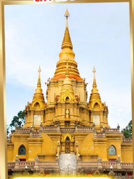
วัดพุทธาริวาส