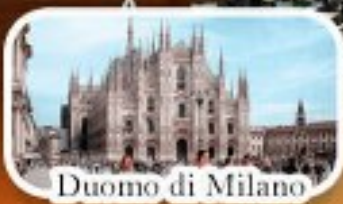
Duomo di Milano