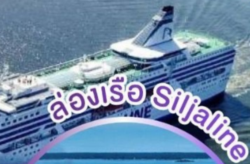
ล่องเรือ Siljaline

ล่องเรือและพักบนเรือสำราญ SILJALINE ล่องเรือและพักบนเรือสำราญ DFDS SEAWAY มีบีนภายในไม่ต้องนั่งรถไกล