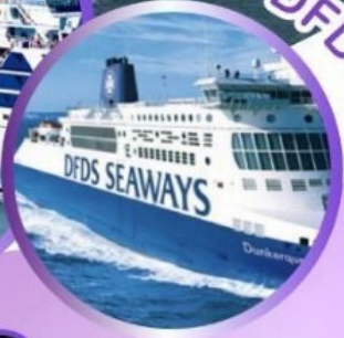
ล่องเรือ DFDS