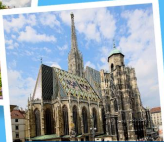
มหาวิหารแมททีอัส

เยอรมนี ออสเตรีย เชก สโลวาเกีย ฮังการี 11 วัน 8 คืน