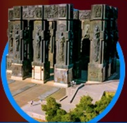
อนุสาวรีย์ประวัติศาสตร์