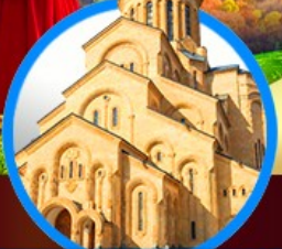
โบสถ์ทรินิตี้ เมืองทบิลีซี