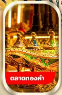
ตลาดทองคำ