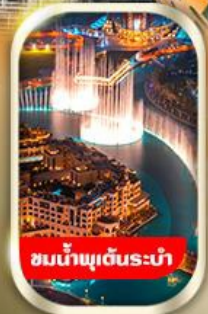
ชมน้ำพุเต้นระบำ

นั่งรถ 4WD ชมทะเลทรายอาหาร พร้อมทานดินเนอร์อาราเบีย