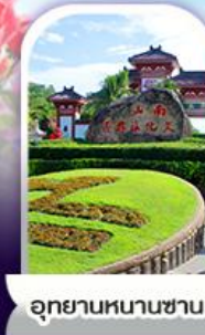
อุทยานหนานชาน

ทางเดินริมชายทะเลซานย่า - ทุ่งดอกกุหลาบอ่าวย่าหลง อุทยานหนานชาน - เทียบบนเกาะดอกไม้ - ทุ่งเกลือพันปี ช้อปปิ้งในมาร์เก็ตถนนโบราณจีไหลว