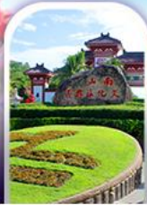
อุทยานหนานซาน

ทางเดินริมชายทะเลซานย่า • กุ้งดอกกุหลาบอ่าวย่าหลง อุทยานหนานซาน • เทียบบนเกาะดอกไม้ • กุ้งเกลือพันปี ช้อปปิ้งไนท์มาร์เก็ตถนนโบราณฉีหลว