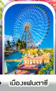
เมืองแฟนตาซี