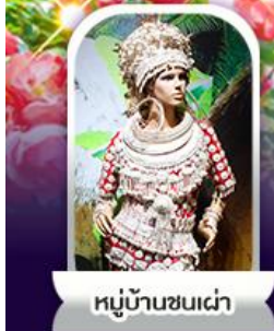
หมู่บ้านชนเผ่า