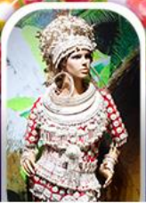
หมู่บ้านชนเผ่า