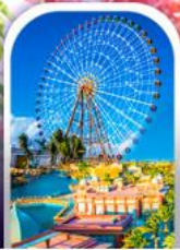
เมืองแฟนตาซี