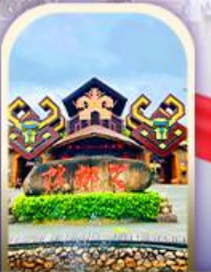
หมู่บ้านชนเผ่า