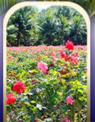
ทุ่งอ่าวย่าหลอง