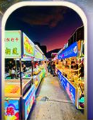
ตลาดอิหัง