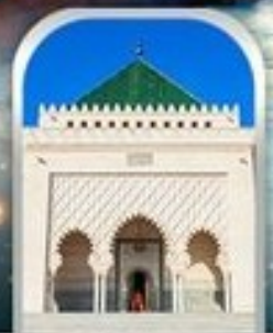
MOHAMMED V SQUARE