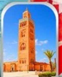
JEMAA EL-FNAA MARRAKESH