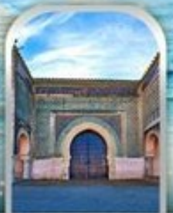
KASBAH OF MOULAY ISMAIL