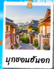
นูกซอนฮันอก