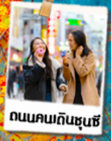
ถนนคนเดินชุนซี