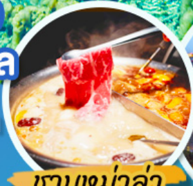
ซาบูหม่าล่า