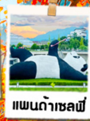
แพนด้าเซลล์